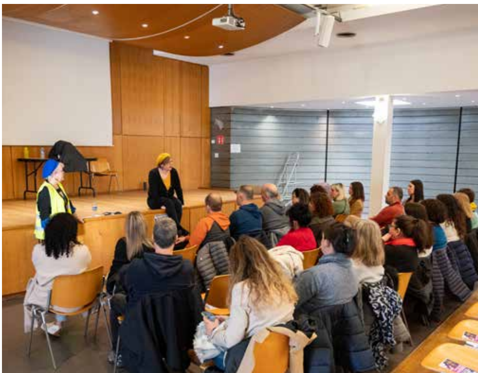
Les actions en faveur de l'égalité des genres ne manqueront pas.

Début mars, l'égalité femmes/hommes sera à l'honneur grâce aux actions portées en lien avec les associations déodatiennes.