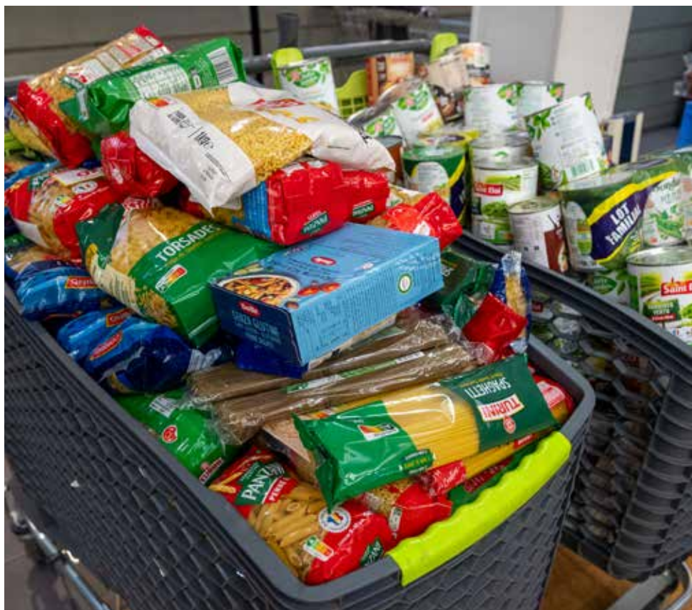
Les produits de première nécessité seront principalement récoltés dans la salle Carbonnar, du 30 janvier au 6 février.

Si vous souhaitez apporter votre aide lors de la tenue d'un stand solidaire, il n'est pas trop tard ! Il vous suffit de vous signaler par mail à grande-collecte@ville-saintdie.fr .