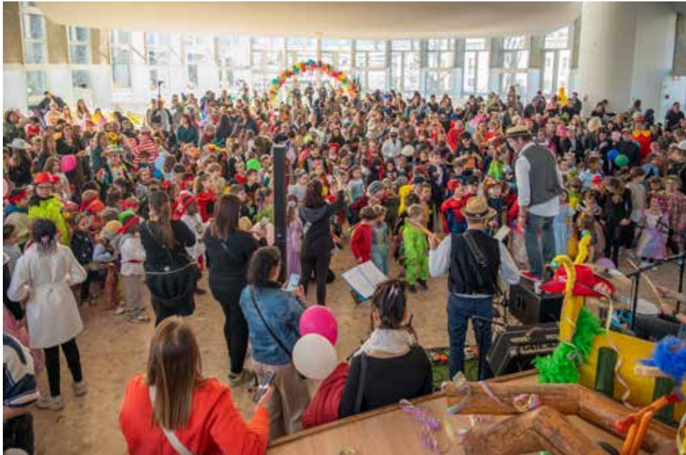
La fête promet encore d'être belle pour le Carnaval 2026.