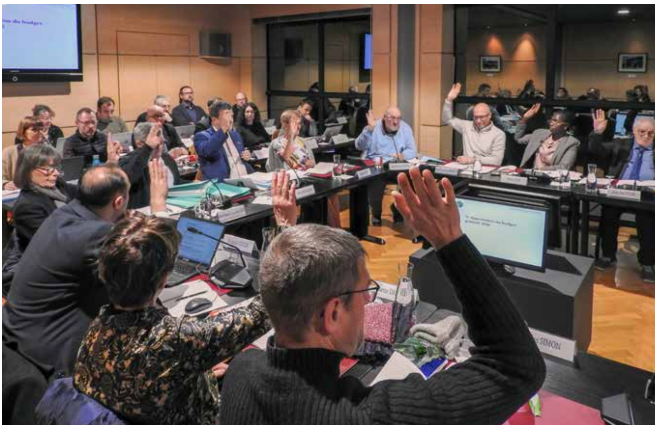
Le conseil municipal a voté le budget primitif le 4 décembre 2025.