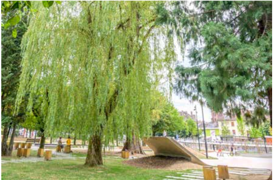
Le vert est présent partout dans la ville.

L e bien-être passe d'abord par un environnement qui le favorise. À Saint-Dié-des-Vosges, dans le cadre du programme Territoire durable, dont la deuxième phase est en cours depuis 2016, et dont le renouvellement est prévu pour 2026, tout est mis en œuvre pour préserver le cadre de vie. Cela passe par la création de parcs, la plantation d'arbres mais aussi par des actions en faveur de la propreté, à l'image des campagnes contre les mégots et les déjections canines sans oublier le Grand Nettoyage XXL. Préserver l'environnement, c'est aussi l'adapter au changement climatique : végétaliser les cours d'école et les cimetières pour désimperméabiliser les sols et favoriser l'infiltration de l'eau est une façon d'y parvenir. Ressource vitale, l'eau fait l'objet de nombreux contrôles