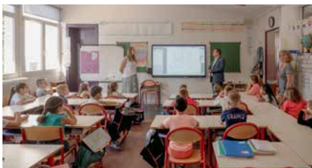
L'intervention permet aux enfants d'être sensibilisés à la cause.

ils sont venus à l'épicerie, et cela leur tenait à cœur de rendre la pareille », poursuit-elle. Pour compléter cette intervention, un chariot sera installé dans chaque établissement. Libre ensuite, aux élèves, membres du corps enseignant ou personnel, de venir déposer un ou plusieurs produits de première nécessité (voir la liste sur www.saint-die-des-vosges.fr ) et ainsi contribuer à la réussite de cette troisième édition. ●