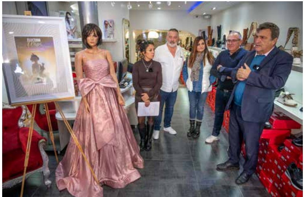
Les critères de participation au concours Miss Saint-Dié-des-Vosges ont été dévoilés.

Infos et réservations sur letincelle.sddv.fr ●