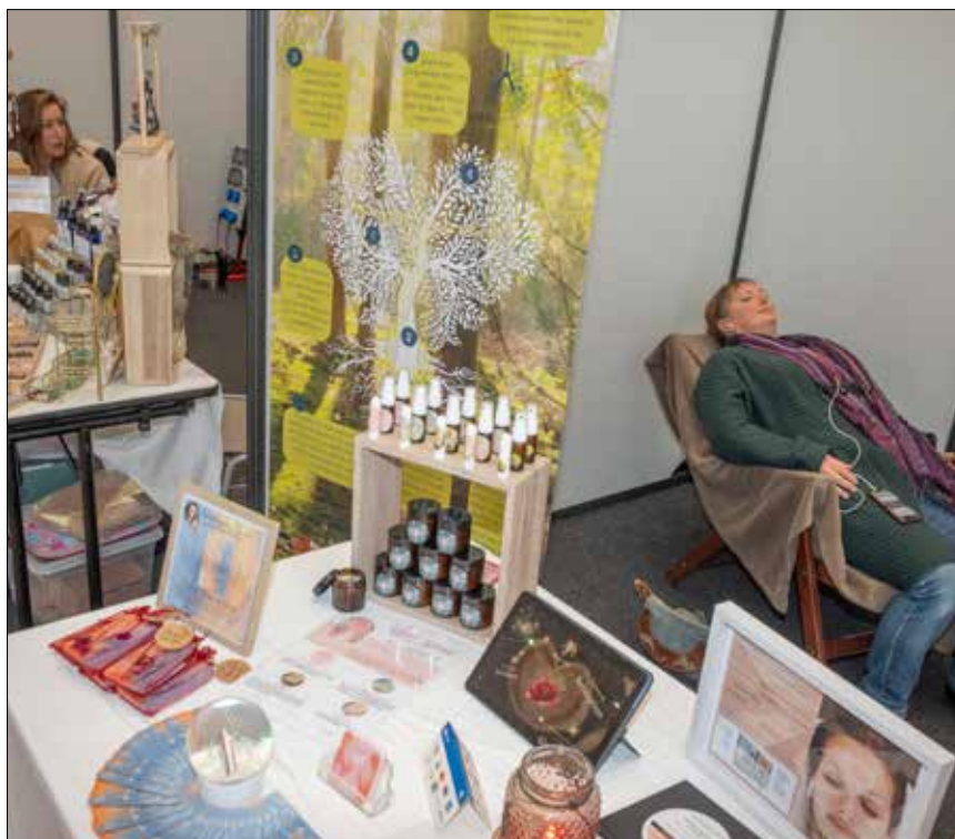
Le salon du Bien-être permet notamment de se détendre gratuitement.