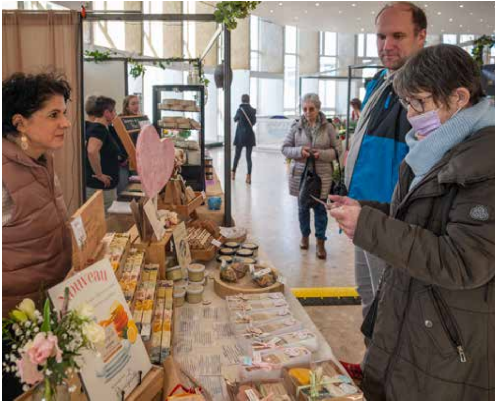
La Table Vosgienne sera axée sur la thématique de l'écologie, des circuits courts et du zéro déchet.

Le forum des lycéens dédié aux formations post-bac se déroulera le jeudi 29 janvier de 8 h à 16 h à l'Espace François-Mitterrand ●