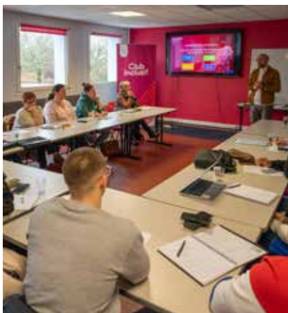
Les clubs ont été formés au programme Club inclusif.

P révenir les complications, réduire les hospitalisations, diminuer la prise de médicaments... les bienfaits de la pratique sportive pour la santé sont nombreux. Mais pour que chacun en profite, encore faut-il que l'activité physique soit réellement accessible à tous. Avec l'aide précieuse des 86 clubs issus du tissu associatif, les actions ne manquent pas dans la ville pour permettre à chacune et chacun de fournir un bon nombre d'efforts. Par exemple, le dispositif Prescri'Mouv, dispensé par l'APS Vosges, permet à des personnes atteintes d'affections de longue durée, de troubles musculo-squelettiques, d'obésité ou de soucis cardiaques, de bénéficier d'un cycle de