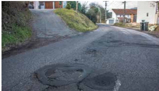
L'avenue du Cimetière-Militaire sera refaite.

Installée dans le parc des sports Edmond-et-Jean-Woehrlé, la piste d'athlétisme ne permet plus de s'entraîner dans des conditions optimales. Sa réfection complète et sa sécurisation pourraient commencer dans le courant du premier semestre. Montant estimé des travaux : 1,8 million d'euros.