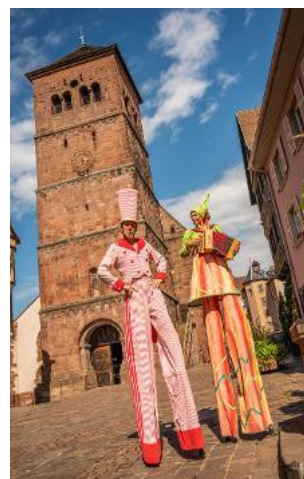
Des animations égayent le week-end.

Les échassiers de la Cie Acrobales, les contes des Fées du Logis, le trio musical Centvingt forceront l'admiration. Les familles pourront tester le sentier sensoriel «pieds nus», la fresque géante ou encore la Photobox. Pour les enfants, un manège Cricri issu de la fête foraine