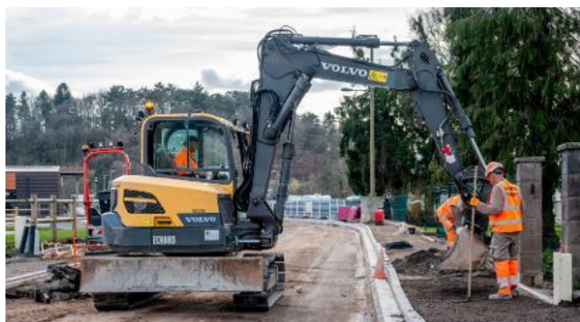
L'avenue Jean-Prouvé était en travaux ces derniers mois.

En collaboration avec la communauté d'agglomération et le Département, l'avenue Jean-Prouvé a été refaite de fond en comble.