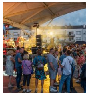
Le bal démarrera à 21 h.

populaire sera organisé sur la place du Marché entre 21 h et minuit. Entre-temps, il s'arrêtera aux alentours de 22 h pour laisser le temps à tous les participants de trouver une bonne place afin d'assister aux feux d'artifice tirés à 22 h 30 depuis le parc Jean-Mansuy. ●