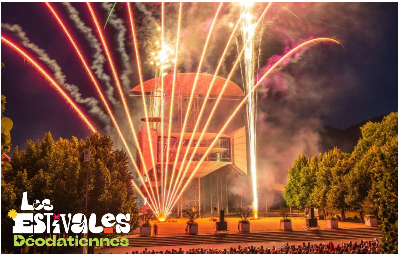
Les feux d'artifices s'annoncent, une fois de plus, sublimes.