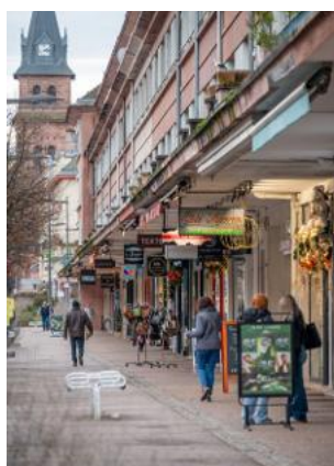
Les commerces seront sensibilisés à l'accessibilité.

En mai, la Direction départementale des Territoires (DDT) va sensibiliser les commerces de 5 e catégorie au sujet de l'accessibilité.