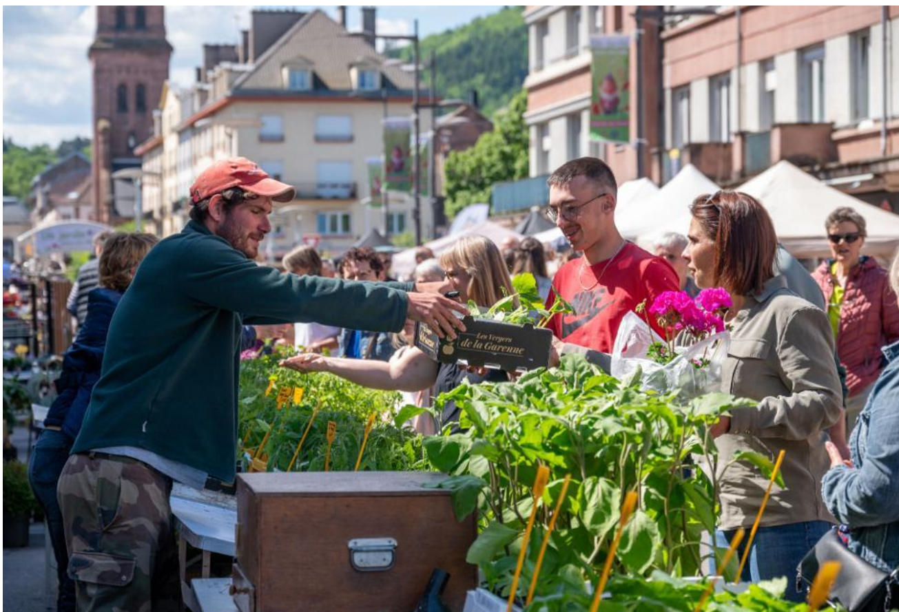
Le centre-ville se transformera en un immense marché aux plantes le week-end du 16 et 17 mai.