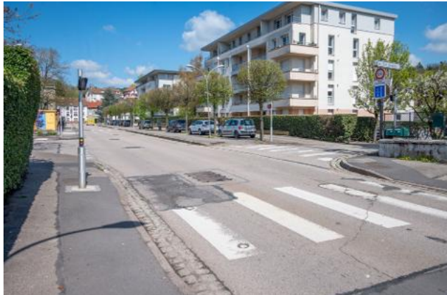
Des travaux perturberont la circulation rue du 31 e -BCP.

S ynonyme de vacances pour les scolaires, le cœur de la période estivale sera aussi synonyme de travaux dans la rue du 31 e -BCP. À partir du 6 juillet, pour un bon mois et demi, le chantier consistera à combler une cavité de six mètres sur dix, laissée par un ancien cours d'eau souterrain qui alimentait une ancienne usine. Ce rebouchage sera aussi l'occasion de réparer les tuyaux du réseau de chaleur rongés par l'humidité, de déplacer les réseaux secs et de refaire l'enrobé sur une surface de 300 m 2 . Pendant toute la durée des travaux, la rue sera