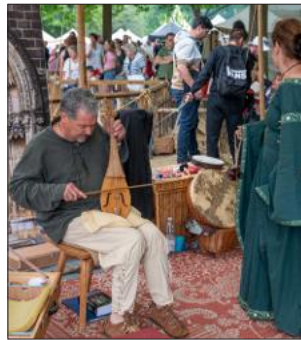
La Festoye du Mansuy vivra sa 6 e édition.

Samedi 4 et dimanche 5 juillet de 10 h à 18 h Entrée 1 journée : 5 € / Entrée 2 journées : 7 € / Gratuit pour les moins de 12 ans. ●