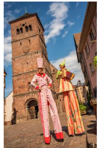
Des animations égayent le week-end.

Les échassiers de la Cie Acrobales, les contes des Fées du Logis, le trio musical Centvingt forceront l'admiration. Les familles pourront tester le sentier sensoriel «pieds nus», la fresque géante ou encore la Photobox. Pour les enfants, un manège Cricri issu de la fête foraine