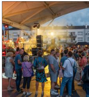
Le bal démarrera à 21 h.

populaire sera organisé sur la place du Marché entre 21 h et minuit. Entre-temps, il s'arrêtera aux alentours de 22 h pour laisser le temps à tous les participants de trouver une bonne place afin d'assister aux feux d'artifice tirés à 22 h 30 depuis le parc Jean-Mansuy. ●