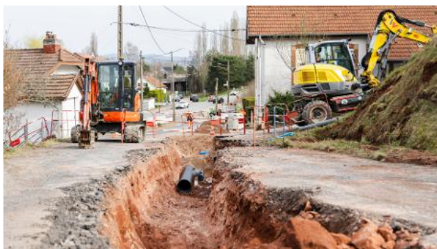
L'avenue du Cimetière-Militaire rajeunit.

tronçon allant du n°1 de l'avenue du Cimetière-Militaire jusqu'à l'intersection avec la rue du Souvenir-Français. Le chantier, mené et financé par la communauté d'agglomération dans un premier temps, consiste à renforcer l'alimentation en eau potable (88 200 €), à refaire les réseaux d'eaux usées (27 700 €) et à créer un réseau pluvial (11 000 €). Sur cette même partie, la relève sera ensuite prise par la Ville pour enfouir les réseaux secs. Lorsqu'ils seront effectués, ces travaux seront