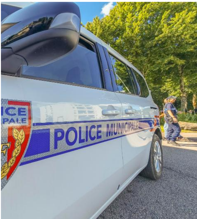
La police municipale verra son effectif être renforcé.