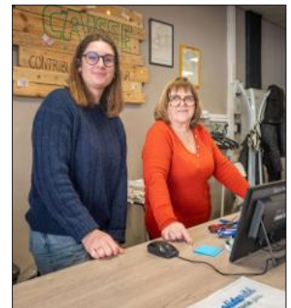
Une salariée et des bénévoles tiennent la boutique.

Ouverture du mardi au samedi de 12 h à 18 h 30 5 rue Thiers ●