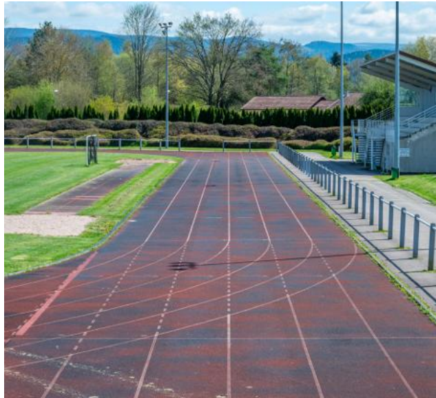
La piste du terrain d'athlétisme sera refaite.

Il n'y a pas à tourner en rond : les réalisations de début de mandat seront celles qui ont été budgétées en décembre 2025. Une enveloppe de 6,5 millions, en hausse par rapport à l'an dernier, consacrée notamment à l'amélioration du cadre de vie.