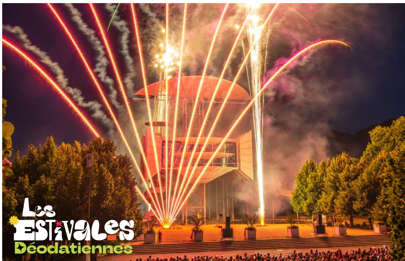
Les feux d'artifices s'annoncent, une fois de plus, sublimes.