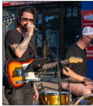
Divers groupes se produiront au centre-ville.