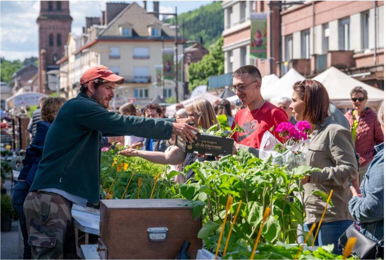
Le centre-ville se transformera en un immense marché aux plantes le week-end du 16 et 17 mai.