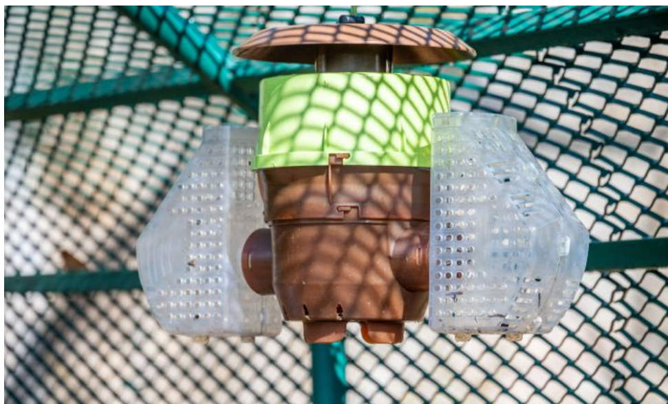
La Ville détient une dizaine de pièges à frelons asiatiques.

Zone 5 - La Bolle, Les Tiges, ZAC Hellieule 1 et 3 : tous les mardis ●