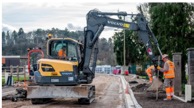
L'avenue Jean-Prouvé était en travaux ces derniers mois.

En collaboration avec la communauté d'agglomération et le Département, l'avenue Jean-Prouvé a été refaite de fond en comble.