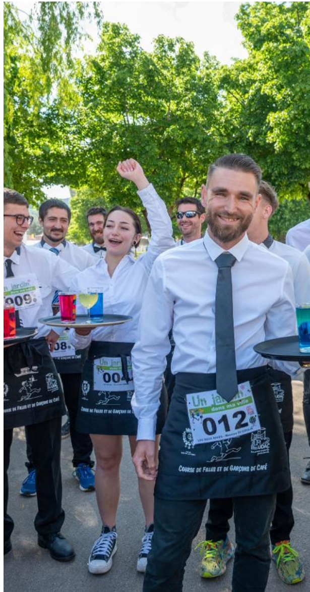
La course de garçons de café : un incontournable du week-end !

Sur le jardin japonais, les expositions de carillons en matériaux de récupération fabriqués dans le cadre des activités scolaires et péri-scolaires par les écoliers de Saint-Dié-des-Vosges mériteront le détour. Et on appréciera une remarquable présentation de photos géantes de la Scierie du Lançois, toutes mises à disposition gracieusement. Sur le stand de l'UDAC, tout en se régaland de son contenu de friandises artisanales, la boîte de bonbons CDHV soulignera les couleurs de l'événement. Le Conseil municipal junior s'investira pour proposer des jeux aux enfants. Côté bien pratique, il se portera à disposition du public pour le service à la brouette. Une aide pourra ainsi être apportée aux clients pour le transport des végétaux jusqu'à leurs véhicules. L'entrée et les animations du Jardin dans ma ville sont entièrement gratuites. ●