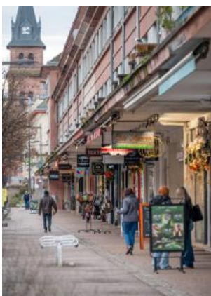
Les commerces seront sensibilisés à l'accessibilité.

En mai, la Direction départementale des Territoires (DDT) va sensibiliser les commerces de 5 e catégorie au sujet de l'accessibilité.